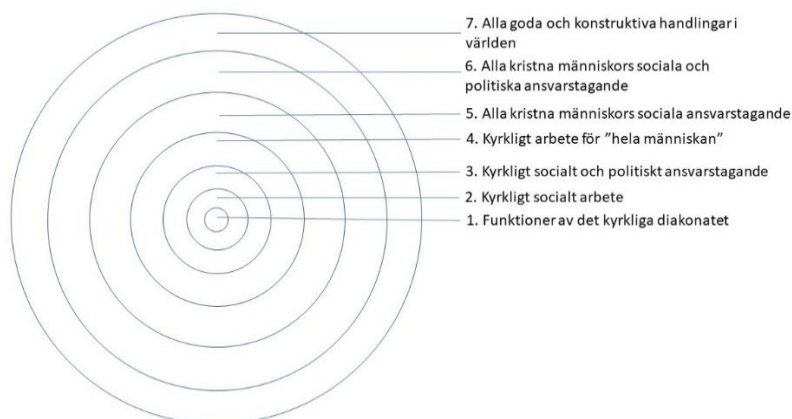
Figur 1: Ett koncentriskt diakonibegrepp. Källa: Blenninger (1989) s 43 – 48

Några av dessa komplexiteter fångas i Erik Blenningers ”koncentriska diakonibegrepp”, som han beskriver som ett sätt att samordna definitionsförslag för diakoni, från en snäv diakonibestämmning till ett allt vidare begreppsomfång. 13