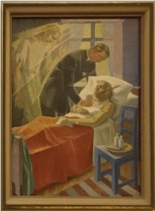
Del av altartavlan i Stora Sköndals kyrka, målad av konstnären Gunnar Torhamn och skänkt av Svenska Diakonförbundet.

Argumentet om en manlig pionjärinsats inom sjukvården, med hänseende till vad den tyska författaren och den svenske föredragshållaren beskriver som en risk med kvinnlig emancipation, kan i ett teoretiskt perspektiv förstås som en maskuliniseringsstrategi.