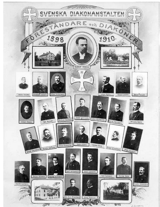
Svenska Diakonsällskapet föreståndare och diakoner 1910.

Prästeståndet leder anstalten, diakonen är underordnad föreståndaren/prästen, men kliver in i husfaderns roll i vårdverksamheten, som betraktas som ett hushåll och benämns hem. Diakoner och provdiakoner är underordnade föreståndaren och »barnen», i detta fall patienterna, har att underordna sig husfadern och bröderna. Över- och underordningsprinciperna ska förstås utifrån den innebörd som läroämbetet gavs enligt hustavlans ordning. Kyrkan var den instans som hade ansvar för att hushållet och därmed att samhällsgemenskapen fungerade. Det var inte fråga om enbart en hierarkisk och patriarkal ordning, utan en ordning som byggde på ett samspel mellan grupper i samhället, med utgångspunkt i föreställningen om en av Gud given samhällsgemenskap, där den överordnade hade ansvar för de underordnades andliga och kroppsliga välfärd.